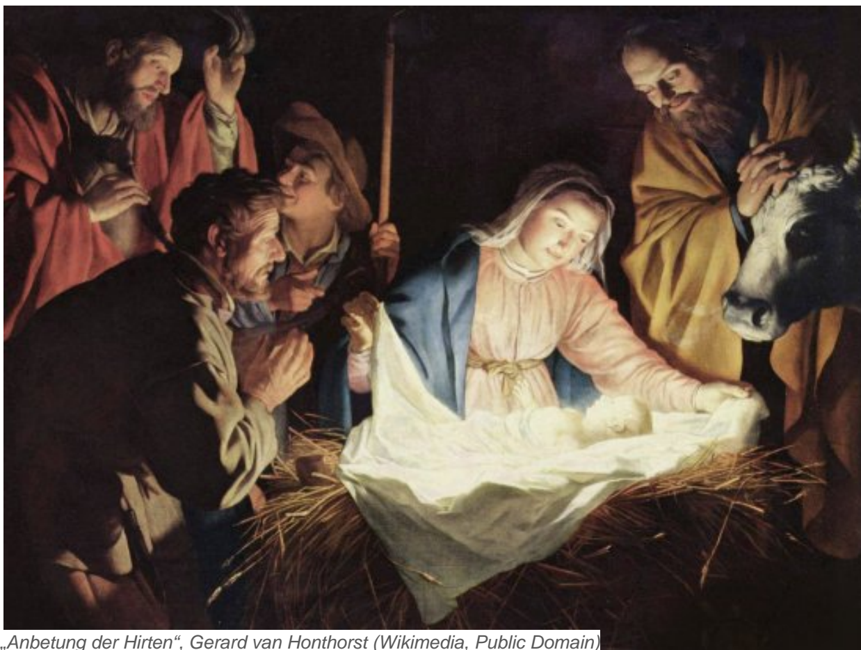
„Anbetung der Hirten“, Gerard van Honthorst

Der niederländische Maler Gerrit van Honthorst hat diesen Glanz, der im Stall von Bethlehem von dem neugeborenen Kind auf die Hirten ausgestrahlt hat, in seinem bekannten Gemälde „Anbetung der Hirten“ besonders eindrucksvoll dargestellt: wusste nicht, dass die Haut seines Angesichts glänzte, weil er mit Gott geredet hatte.“