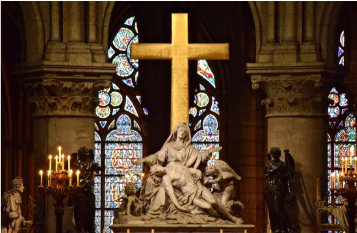
Goldenes Kreuz in der Notre Dame (vor dem Brand); Foto Omar David Sandoval Sida, CC BY-SA 4.0, bit.ly/2P4fkfO

In diesem Motiv können wir ein beeindruckendes und gleichnishaftes Bild für unsere Zeit und unsere Gesellschaft erkennen. So wie in dieser beschädigten Kathedrale strahlt der göttliche Glanz des Kreuzes bis heute in unsere dunkle und zerstörerische Gegenwart mit all ihren zahllosen Nöten, Problemen und Hoffnungslosigkeiten hinein und ruft uns immer wieder eindringlich zu: „Lasst euch versöhnen mit Gott!“