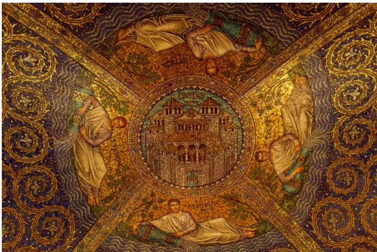
„Civitas Dei“ Mosaik im Aachener Dom

„Die Stadt hatte die Herrlichkeit Gottes; ihr Licht war gleich dem alleredelsten Stein, einem Jaspis, klar wie Kristall“ (Offb. 21,11). „Und ihr Mauerwerk war aus Jaspis und die Stadt aus reinem Gold, gleich reinem Glas. Und die Grundsteine der Mauer um die Stadt waren geschmückt mit allerlei Edelsteinen“ (Offb. 21,18.19). „Und die zwölf Tore waren zwölf Perlen, ein jedes Tor war aus einer einzigen Perle, und der Marktplatz der Stadt war aus reinem Gold wie durchscheinendes Glas“ (Offb. 21,21).