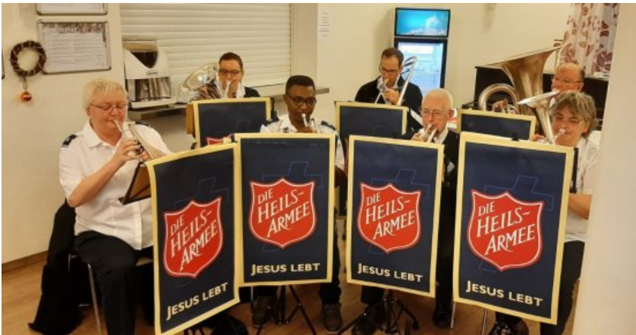
Die Musiker des Korps Mannheim

08.12.2019 • von Karin Räuschel / Korps Mannheim