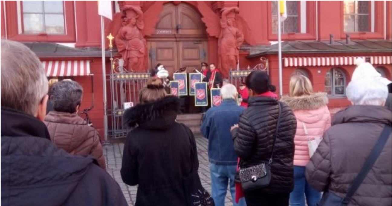
Einige Passanten hielten inne und stimmten mit den Heilsarmee-Musikern ein.

05.12.2019 • von Andrea Weber / Korps Mannheim